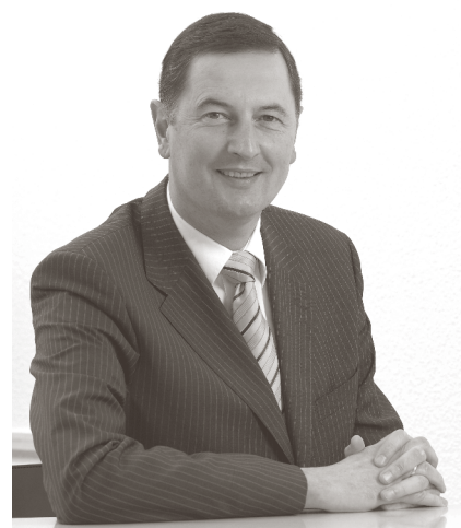
Oberbürgermeister Peter Jung

wurde 2003 eine hervorragende Möglichkeit geschaffen, frische Ideen, besondere Leistungen und unternehmerisches Geschick zu prämiieren.